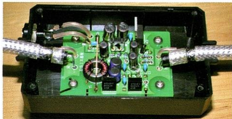
入力側と出力側のケーブルを取り付けたら、基板を取り付け、電源のケーブルを接続