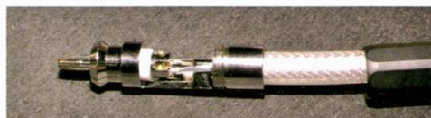
RCAプラグはFURUTECHのFP-106R(現在はFP-106F(R)にモデルチェンジ。¥13,020/4個組)を2個使用