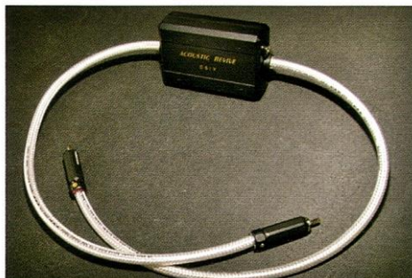
今回、キットを用いて福田屋で自作したDSIX-510。話題のアクセサリの超強力バージョンが完成した!