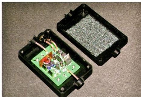
ACOUSTIC REVIVEのDSIX(デジタル・シグナル・アインレーション・エキサイター)自作用キット(¥18,900)の内部。基板は完成し、主なリード線も取り付けられている。オヤイデ電気のウェブ( http://oyaide.com/ )のオンラインショップ、および店頭にて販売中