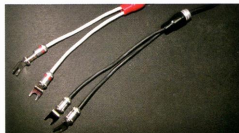
理想的な分配端子が新発売されたので、それを用いてバイワイヤアダプターの最新版を製作