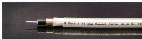
使用したOYAIDEの5N純銀同軸ケーブルFFTVS-510 (¥5,250/m)