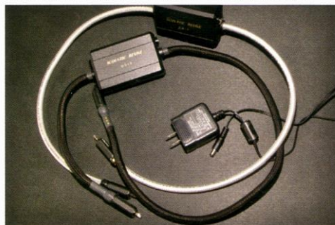
自作品(白ケーブル)と市販品(黒ケーブル)DSIX-1.0の比較。線材に究極の導通特性を誇るPCOCC-A導体を採用したDSIX-1.0PA(¥88,200)が新発売された