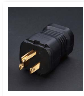
オーディオグレードインレットプラグ