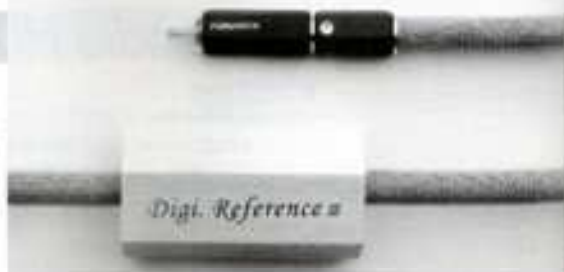
Digi Reference III

中心導体はOCC(単結晶高純度無酸素銅)に独自のα処理を加えたφ0.16mm×37本構成。同社の高級ロジウムメッキRCAプラグを装着。ケーブル中間には電磁波吸収材を外周部に使いノイズフィルター、振動抑制スタビライザーとして作用している。