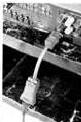
Flow-15はこんな風に1系統1ケーブルで使える

電源の中核ケーブルのように使える高品質フィルター。フルダック Flow-15 (FT15)は、透明コイルとコンデンサーによるフィルター回路を内蔵し、上級機 Full-Cap Filter (FT30)の約半額ノイズ除去性能を掛け合わせた最新技術を投入しています。価格もアップロードオーディオ編集部調べ (税別) ¥54,800