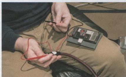
▲メガネ型ケーブルを使用する場合は、極性の確認を忘れずに。なお、Apple TV 4Kの確認をしたところ、外側がホットであった。個体や製造ロットによって異なる可能性もなくはないので、こちらも要確認だ

▲オーディオ用メガネ電源ケーブルは、現在それほど多くの製品が存在しない。ここでは定番のオヤイデケーブルを試した