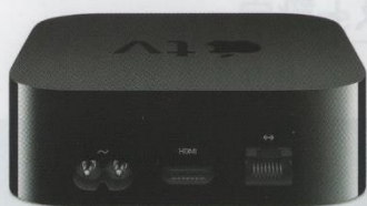
▲Apple TV 4Kの電源は本体に内蔵されるタイプで、端子は2ピンのいわゆるメガネ型。よって、電源ケーブル交換にはメガネ型を使うか、アダプターが必要になる